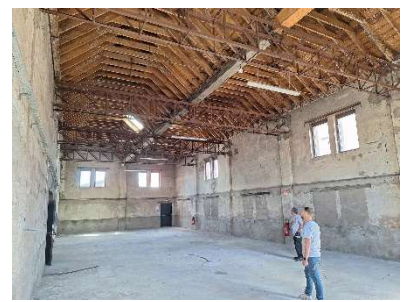
Local de stockage côté est