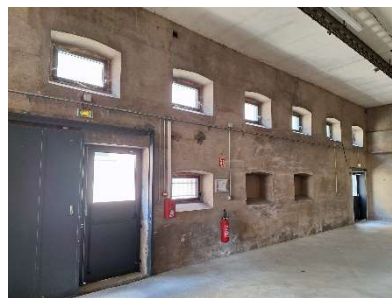
Salle d'exposition côté nord