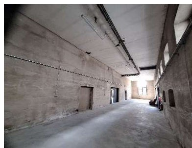
Salle d'exposition côté ouest