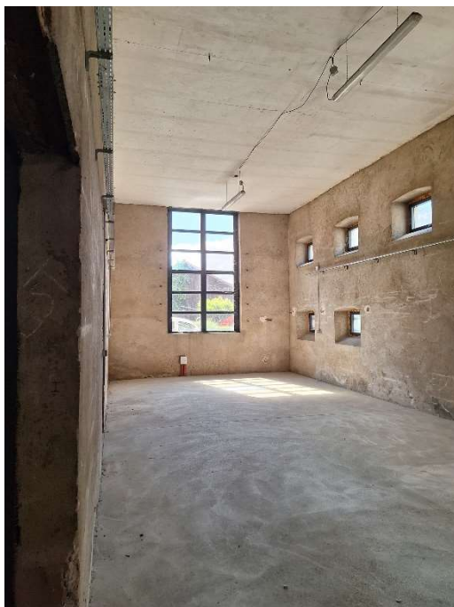
Salle d'exposition côté ouest