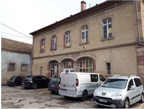
VUE DE L'ANCIENNE ECOLE DES GARÇONS COTE COUR DE LA MAIRIE (PARKING)