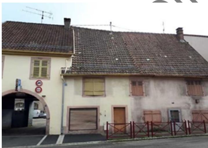
VUE DES 68 ET 70 RUE FLORIVAL