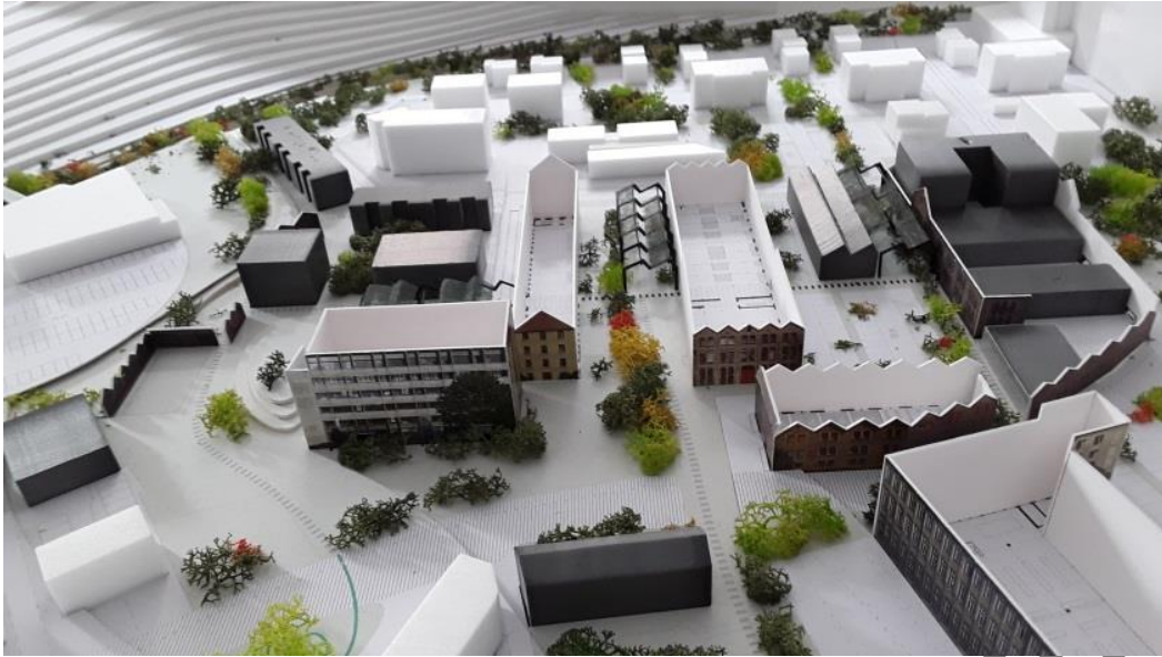
Maquette réalisée en 2020 par Bering lors de l'étude du plan directeur d'aménagement